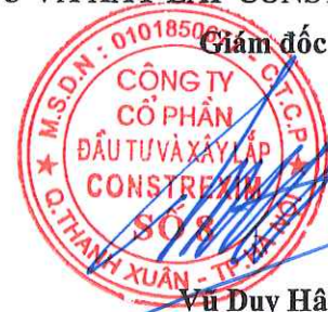
Vũ Duy Hậu

(Các thuyết minh từ trang 10 đến trang 31 là bộ phận hợp thành của Báo cáo tài chính này)