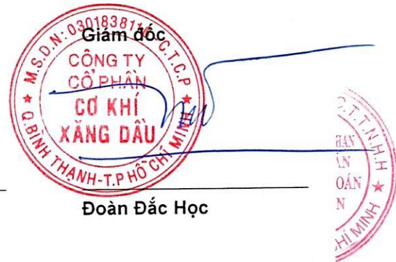
Đoàn Đắc Học