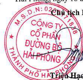
Triệu Hạo Nhiên