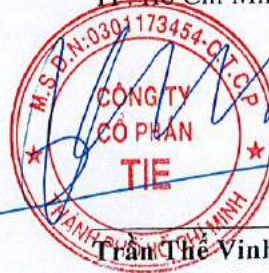
Trần Thế Vinh Chủ tịch Hội đồng quản trị