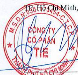
Trần Thế Vinh Chủ tịch Hội đồng quản trị