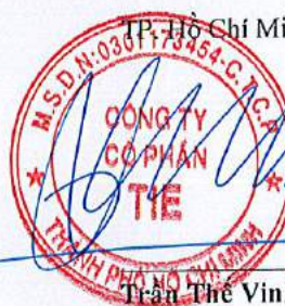
Trần Thế Vinh Chủ tịch Hội đồng quản trị