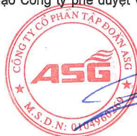
Dương Đức Tính Chủ tịch Hội đồng quản trị