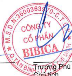
Trương Phú Chiến Chủ tịch