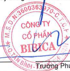
Trương Phú Chiến Chủ tịch