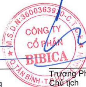
Trương Phú Chiến Chủ tịch