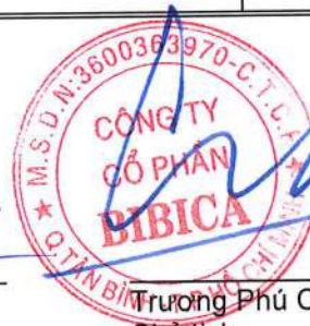
Trương Phú Chiến Chủ tịch