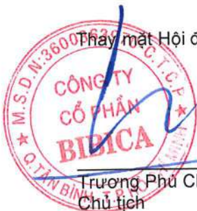
Trương Phú Chiến Chủ tịch