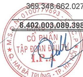
Vũ Hiền Chủ tịch Hội đồng Quản trị Hà Nội, ngày 28 tháng 03 năm 2022