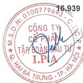
Vũ Hiền Chủ tịch Hội đồng Quản trị Hà Nội, ngày 28 tháng 03 năm 2022