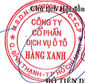
ĐỖ TIẾN DŨNG