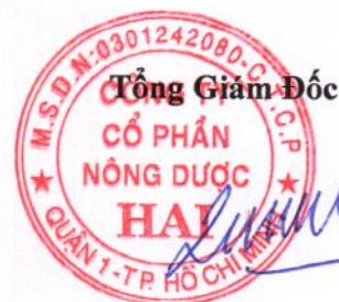
Quách Thành Đồng