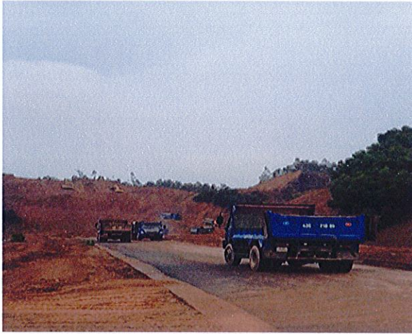
Dự án Đường Trường Sơn Đông (Gói 37G)