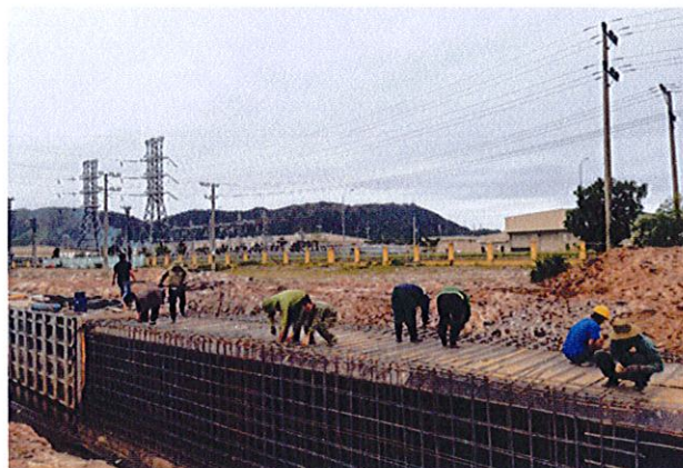
Công nhân thi công DA đường Vành đai 2 Đà Nẵng