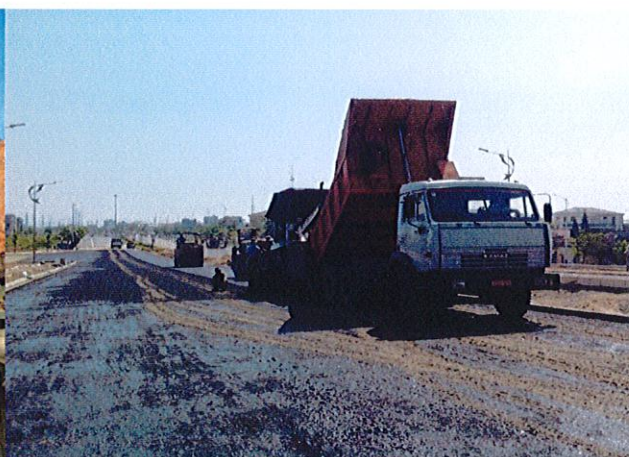
Thi công thăm BTN DA Khu đô thị Thủy Tú-Đà Nẵng (EcoCham)