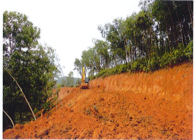
Khu TĐC Xã Hòa Phú, Hòa Vang, Đà Nẵng