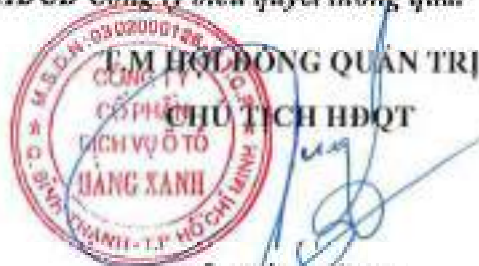
ĐỖ TIẾN DŨNG

Quy chế này có hiệu lực ngay sau khi được ĐHĐCĐ Công ty biểu quyết thông qua.