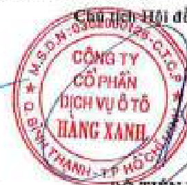
ĐỖ TIẾN DŨNG