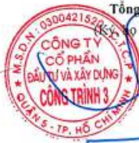
Trần Quốc Đoàn