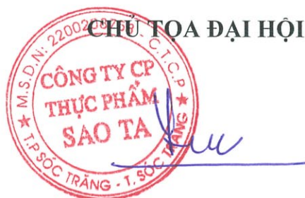
HỒ QUỐC LỰC