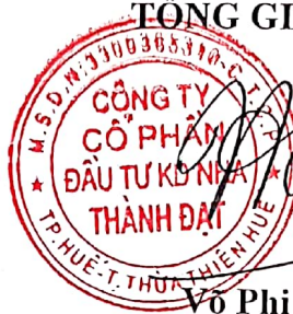
Võ Phi Hùng