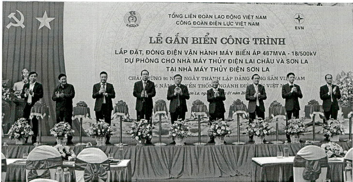
Cắt băng khánh thành công trình MBA 467 MVA – 500 kV do EEMC chế tạo và lắp đặt tại Nhà máy Thủy điện Sơn La