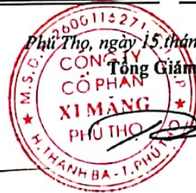
Trần Tuấn Đạt