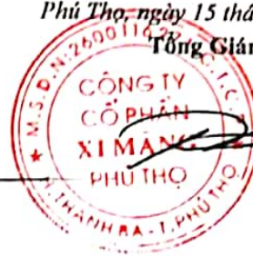
Trần Tuấn Đạt