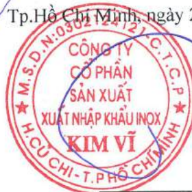
Đỗ Hùng Chủ tịch Hội Đồng Quản Trị