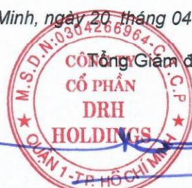
Ngô Đức Sơn