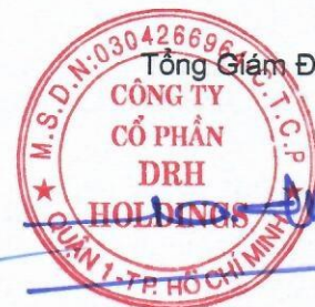
Ngô Đức Sơn