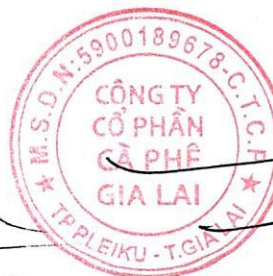
TRỊNH ĐÌNH TRƯỜNG Chủ tịch hội đồng quản trị