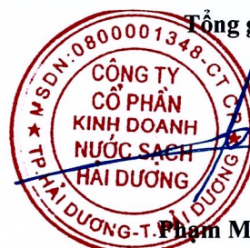
Phạm Minh Cường

(Các thuyết minh từ trang 6 đến trang 27 là bộ phận hợp thành của Báo cáo tài chính giữa niên độ này)