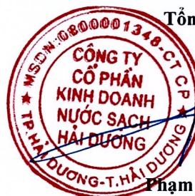
Phạm Minh Cường

(Các thuyết minh từ trang 6 đến trang 27 là bộ phận hợp thành của Báo cáo tài chính giữa niên độ này)