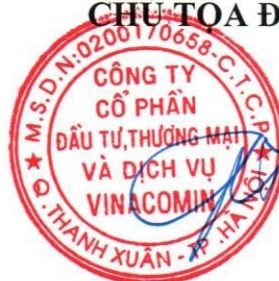
Thiều Quang Thảo