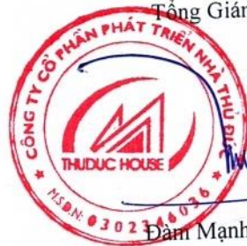
Đàm Mạnh Cường