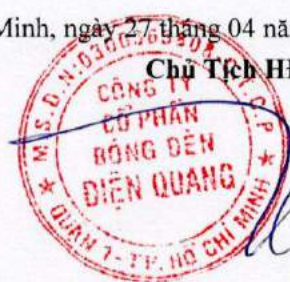
Hồ Quỳnh Hưng