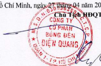
Hồ Quỳnh Hưng