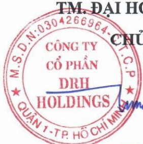
PHAN TÂN ĐẠT