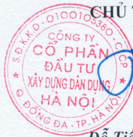
Đỗ Tiến Lợi