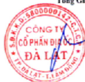
Đình Thanh Tâm

1388c CÔNG TY BIÊN BÊN KẾ TÍNH SỐ KẾ KẾ TÍNH M VIỆT 3. HỒ C