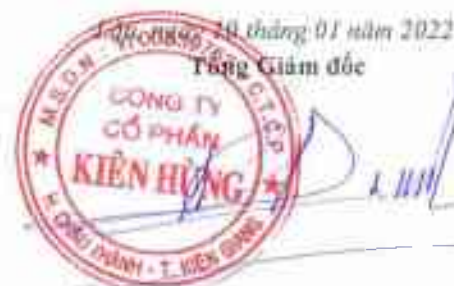
Trần Quốc Dũng