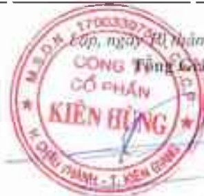
Trần Quốc Dũng