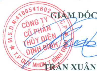
TRẦN XUÂN TOÀN

Kính chúc quý vị khách quý, quý Cổ đông và toàn thể phiên họp mạnh khỏe, hạnh phúc, thành đạt và chúc phiên họp ĐHĐCĐ thường niên 2022 thành công tốt đẹp.