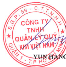
YUN HANG JIN

Chủ tịch Hội đồng thành viên (Ký, họ tên, đóng dấu)