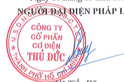
Võ Tiến Dũng