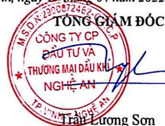
Trần Lương Sơn