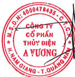
Ngô Việt Hưng