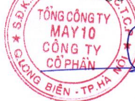
Thân Đức Việt