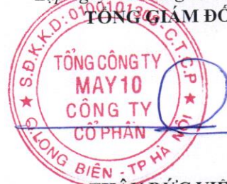
THĂNG ĐỨC VIỆT