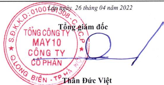
Thân Đức Việt