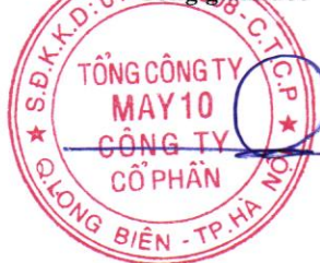
Thân Đức Việt