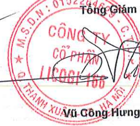
Vũ Công Hưng