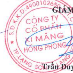
Trần Duyên Tùng