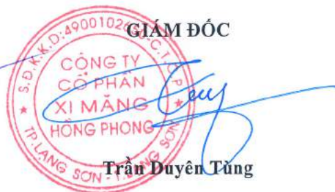
Trần Duyên Tùng