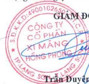
Trần Duyên Tùng