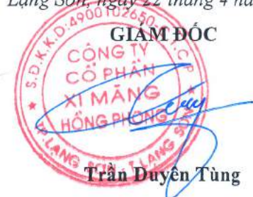
Trần Duyên Tùng