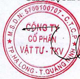
Trần Thế Thành