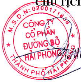
Triệu Hạo Nhiên