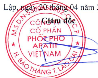
Đặng Tiến Đức