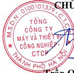
Trần Quốc Toàn