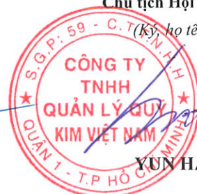
YUN HANG JIN

Chủ tịch Hội đồng thành viên (Ký, họ tên, đóng dấu)