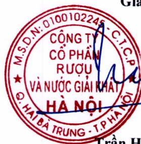
Trần Hậu Cường