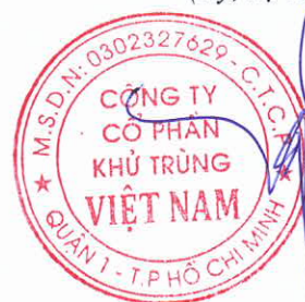
Trương Công Cừ