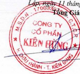
Trần Quốc Dũng