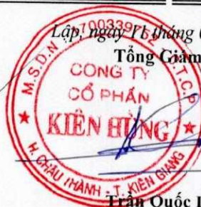
Trần Quốc Dũng