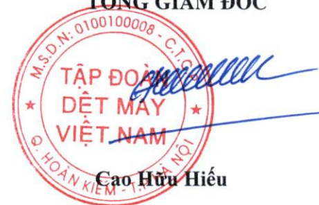
Cao Hữu Hiếu