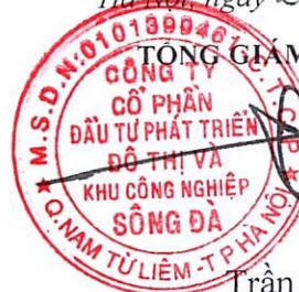
Trần Việt Dũng