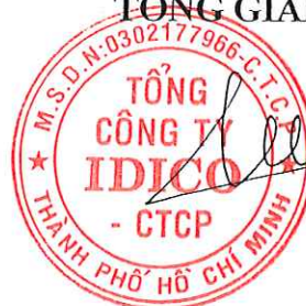
Đặng Chính Trung