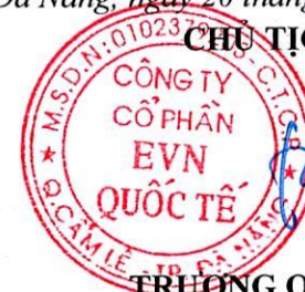
TRƯƠNG QUANG MINH