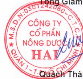
Quách Thành Đồng