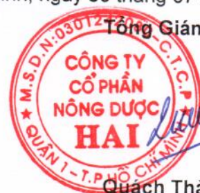
Quách Thành Đồng